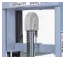
スプロケットカバー 軽くてクリーンな樹脂製カバーを新採用。