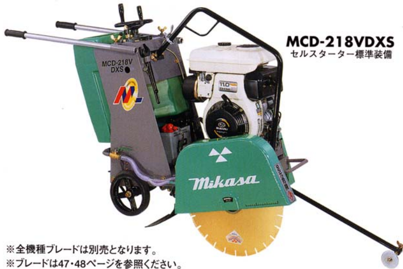
MCD-218V DXS セルスターター標準装備

※全機種ブレードは別売となります。 ※ブレードは47・48ページを参照ください。