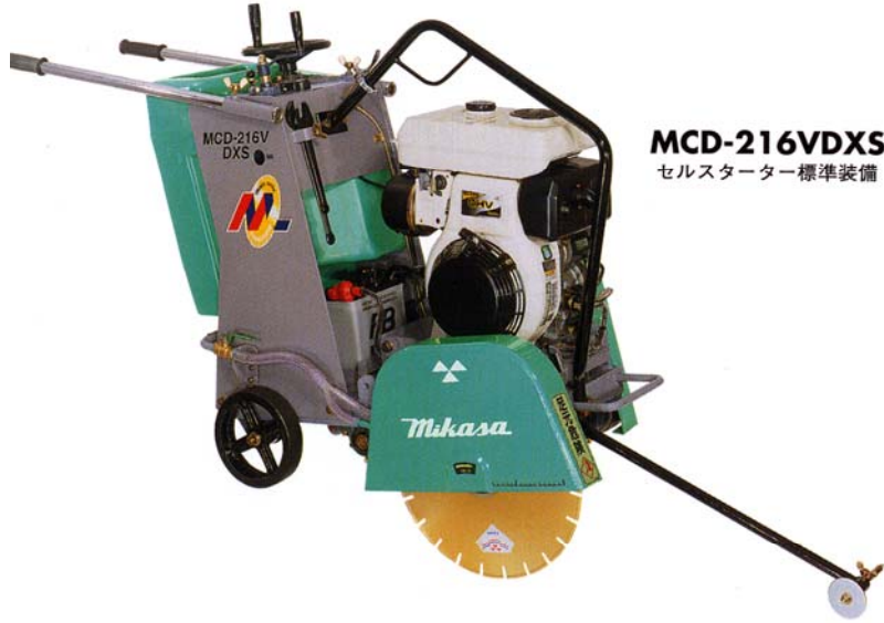
MCD-216V DXS セルスターター標準装備