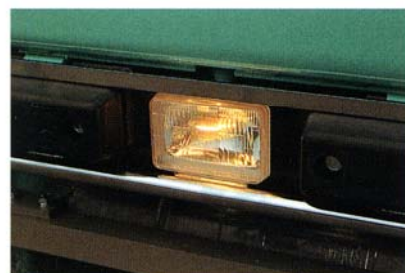
夜間作業に便利な前照灯