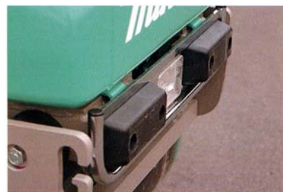
衝撃吸収用ゴムバンパー