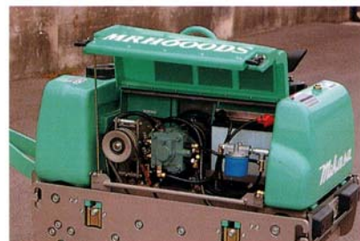
センターカバーはワンタッチオープン