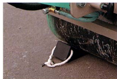
駐車時に使用する歯止め