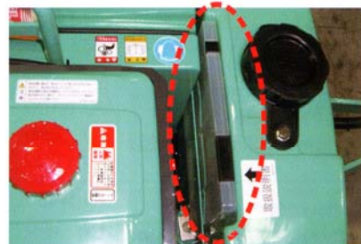
書類ケース収納スペース